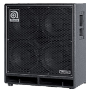
ProNeo 410 HLF