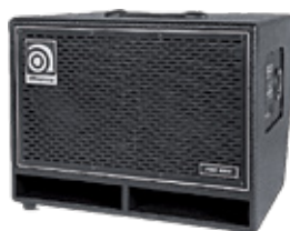
ProNeo 210 HLF