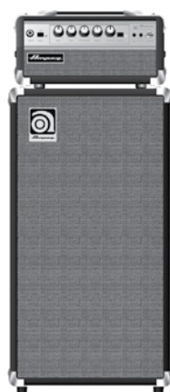
SVT MicroHead con SVT 210AV