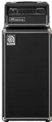
Micro CL Stack