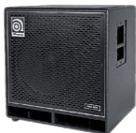
ProNeo 115 HLF