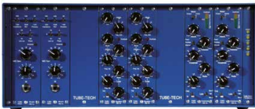
RM 8 - FRONTE (con 6 Moduli installati)