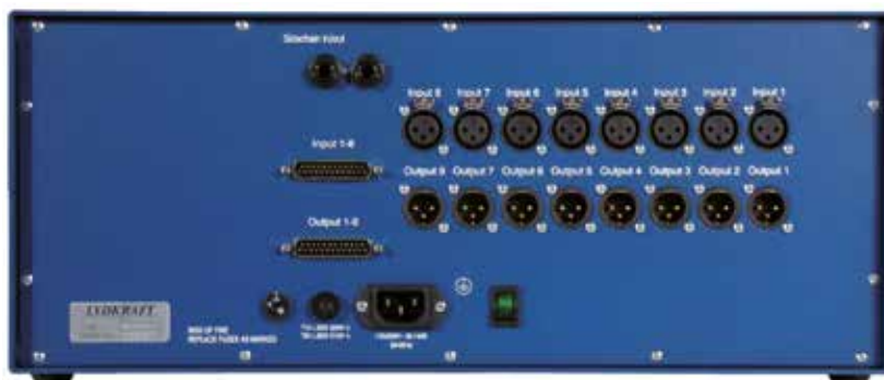
RM 8 - RETRO