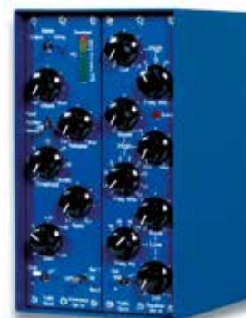
RM 2 - (con 2 Moduli installati)